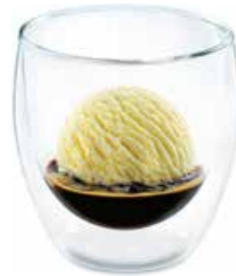
Espresso Royal Espresso & Vanille-Rahmglace CHF 6.00