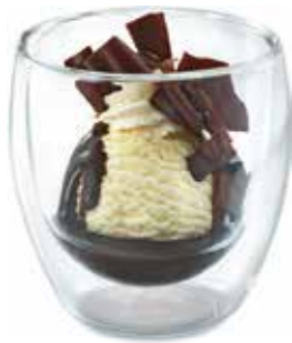
Mini Dänemark Vanille Rahmglace, Schokoladensauce und Rahm CHF 6.00