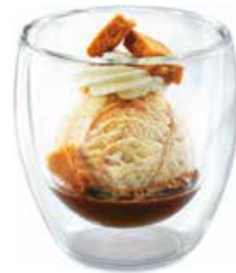
Irish butter coffee Irish Cream-Rahmglace, Espresso und Rahm CHF 6.00