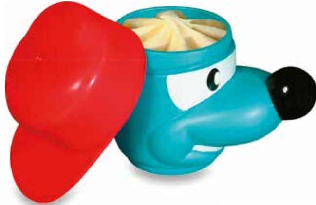
Hugo Becher Vanille-Glace CHF 5.50