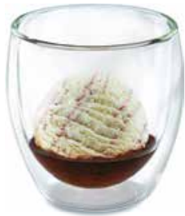
Röteli Duett Röteli Likör & Röteli-Rahmglace CHF 8.00