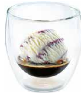
Corretto Fresh Espresso & Grappa-Rahmglace CHF 6.00