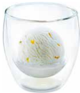
Colonel Fresh Vodka & Zitronen-Sorbet CHF 8.00