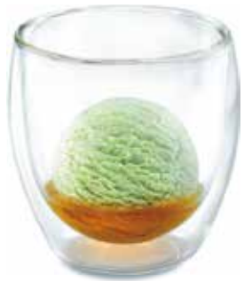
Absinthe Royal Vieille Prune de Bourgogne, Absinthe-Rahmglace CHF 8.00