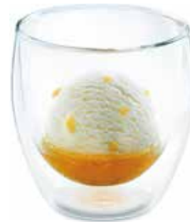
Calvados Duett Calvados & Apfel-Sorbet CHF 8.00