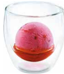
Vieille Prune Duett Vieille Prune & Zwetschgen-Sorbet CHF 8.00