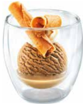
Mini Baileys Café-Rahmglace, Baileys und Rahm CHF 8.00