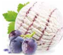
Grappa la Ticinella

Cremige Schokoladen-Rahmglace mit knackigen Cremant-Schokolade-Stücken