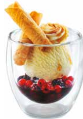
Mini Hot Berry Vanille Rahmglace, heisse Waldbeeren und Rahm CHF 6.00